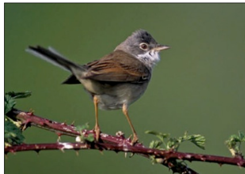
Fauvette grissette, espèce nichant dans les ronciers ou petits bosquets