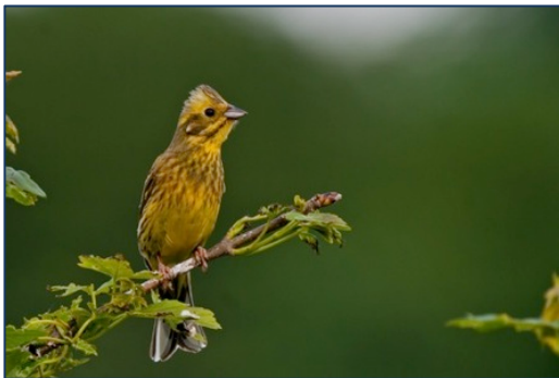
Bruant Jaune, espèce nichant dans les haies

Grive musicienne Huppe fasciée Merle noir Mésange bleue Mésange charbonnière Pie bavarde Pigeon ramier Pigeon biset semi-domestique Pinson des arbres Pouillot véloce Serin cini Tourterelle turque Troglodyte mignon Verdier d'Europe